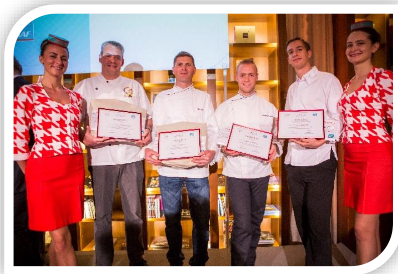
Les 3 lauréats du Prix Goût et Santé des Artisans 2015, ainsi que le Prix Spécial du Jury